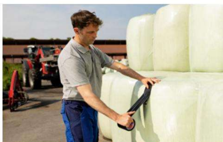
Aplicación a bajas temperaturas durante todo el año.

Proceso de ensilado de películas una vez finalizado su vida útil, habiendo sido probado con éxito en procesos de reciclaje industrial.