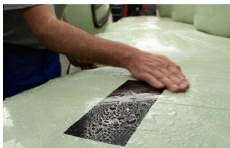
El producto robusto resiste 12 meses al aire libre.