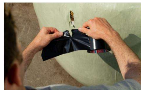
Se puede rasgar con la mano para una fácil aplicación.